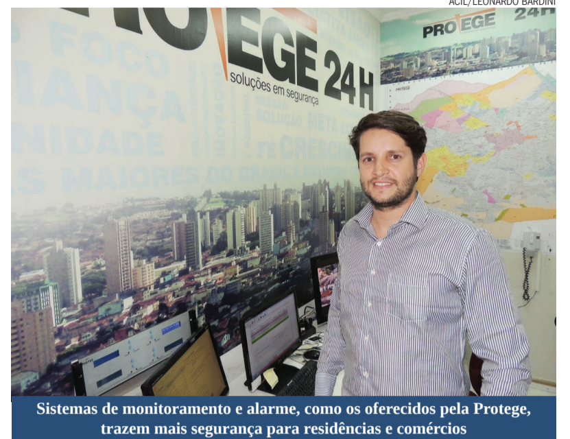
Sistemas de monitoramento e alarme, como os oferecidos pela Protege, trazem mais segurança para residências e comércios

O proprietário dá algumas dicas de segurança, e mostra que alguns gestos e ações podem fazer a diferença em momentos fundamentais, como evitar uma rotina de entrada e saída da residência ou empresa, evitar que objetos valiosos fiquem expostos ao exterior do imóvel (como