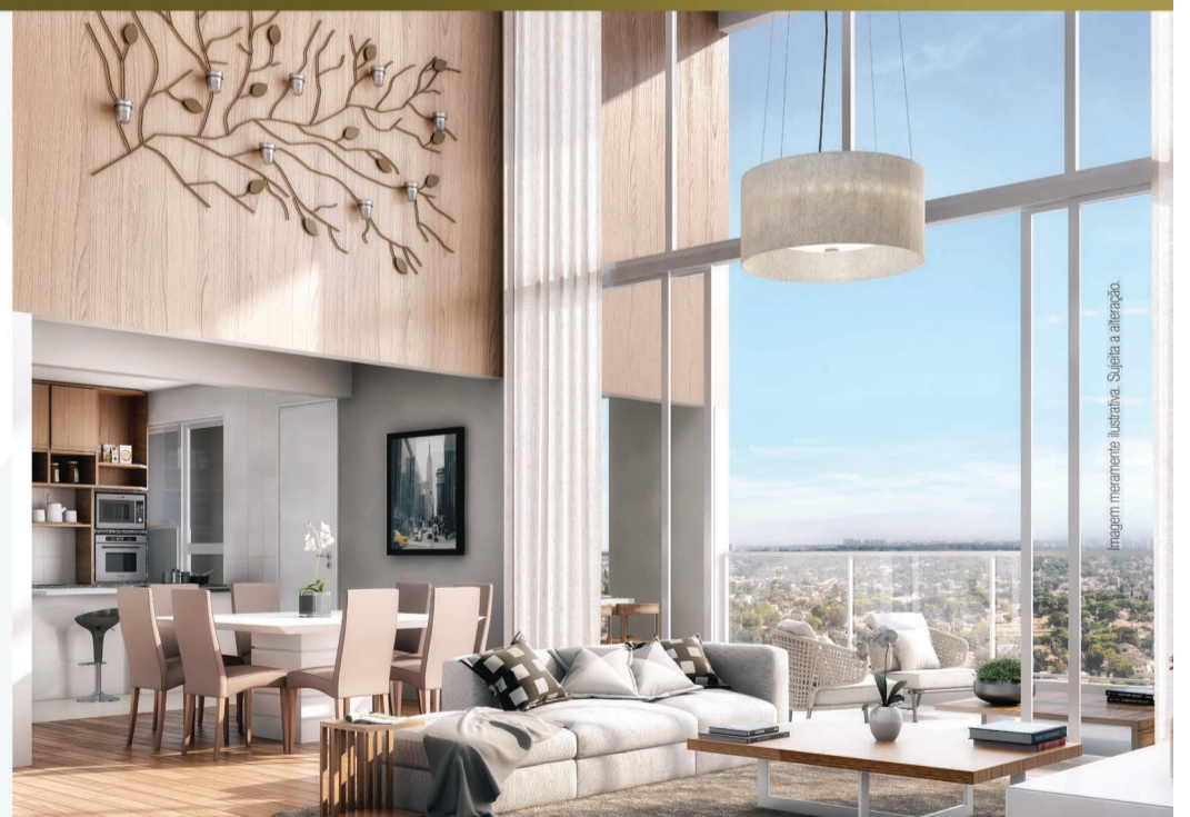
Imagem meramente ilustrativa. Sujeita a alteração.

*O número de vagas irá depender do andar escolhido.