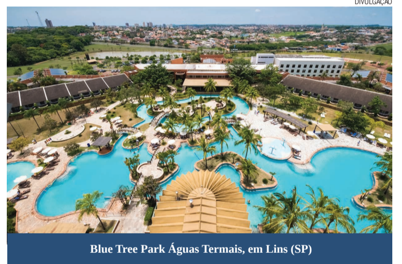
Blue Tree Park Águas Termais, em Lins (SP)

A promoção “Criança Grátis” já está disponível em toda a rede formada por 1.021 lojas exclusivas e por mais de 6.500 agências multimarcas credenciadas em