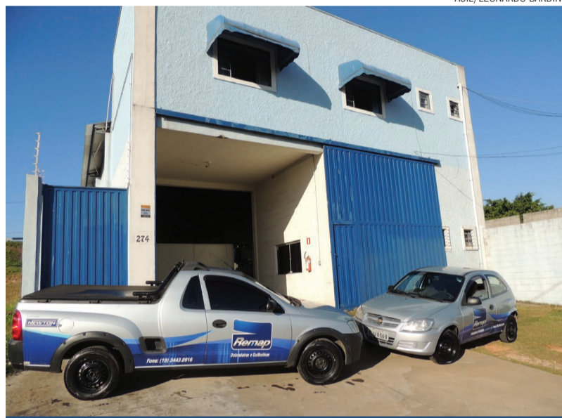
A Remap atende todo o território nacional, e conta com uma equipe altamente especializada

Fundada em 2008, a Remap é uma empresa de manutenção que atua na área de assistência técnica e reforma de máquinas, dobradeiras, guilhotinas e prensas de qualquer marca ou modelo. A empresa atende todo o território nacional, seja indo até o cliente ou recebendo o equipamento em suas instalações. Oferece também afiação de facas para guilhotinas, fabricação de ferramentas e usinagem de peças.